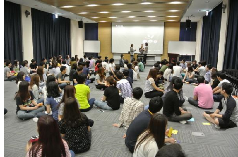
▲ 사전 교육